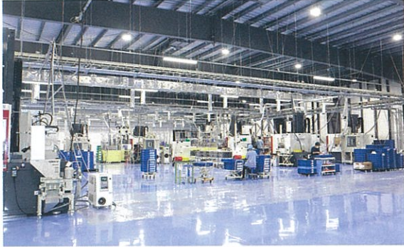
明るく広々とした新工場

延ばしたりするために軽量化がさらに進むと思うので、樹脂化は加速すると予想しています。